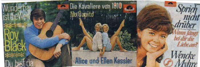
Hits von Roy Black bis Wencke Myhre

4000 Euro Gebühren für Musik und Technik kostet der Sender pro Jahr. Die Günthers versprechen: „Wir spielen auch die nächsten zehn Jahre die besten Schlager.“